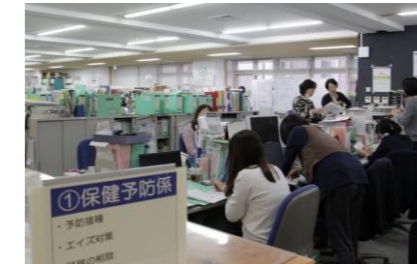
みなと保健所の様子