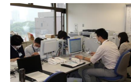
特別定額給付金の申請内容確認の様子