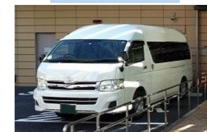
感染症患者の搬送車