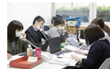
帰国者・接触者相談センターの様子