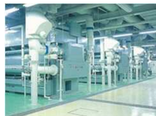
熱発生所施設のイメージ