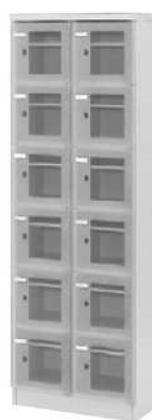
シューズボックス