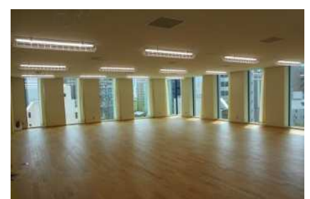
アクティビティルー