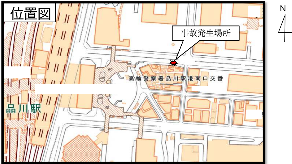
○国土地理院地図 ( http://maps.gsi.go.jp ) での事故発生場所付近イメージ