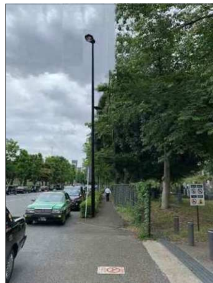
【整備後イメージ図】