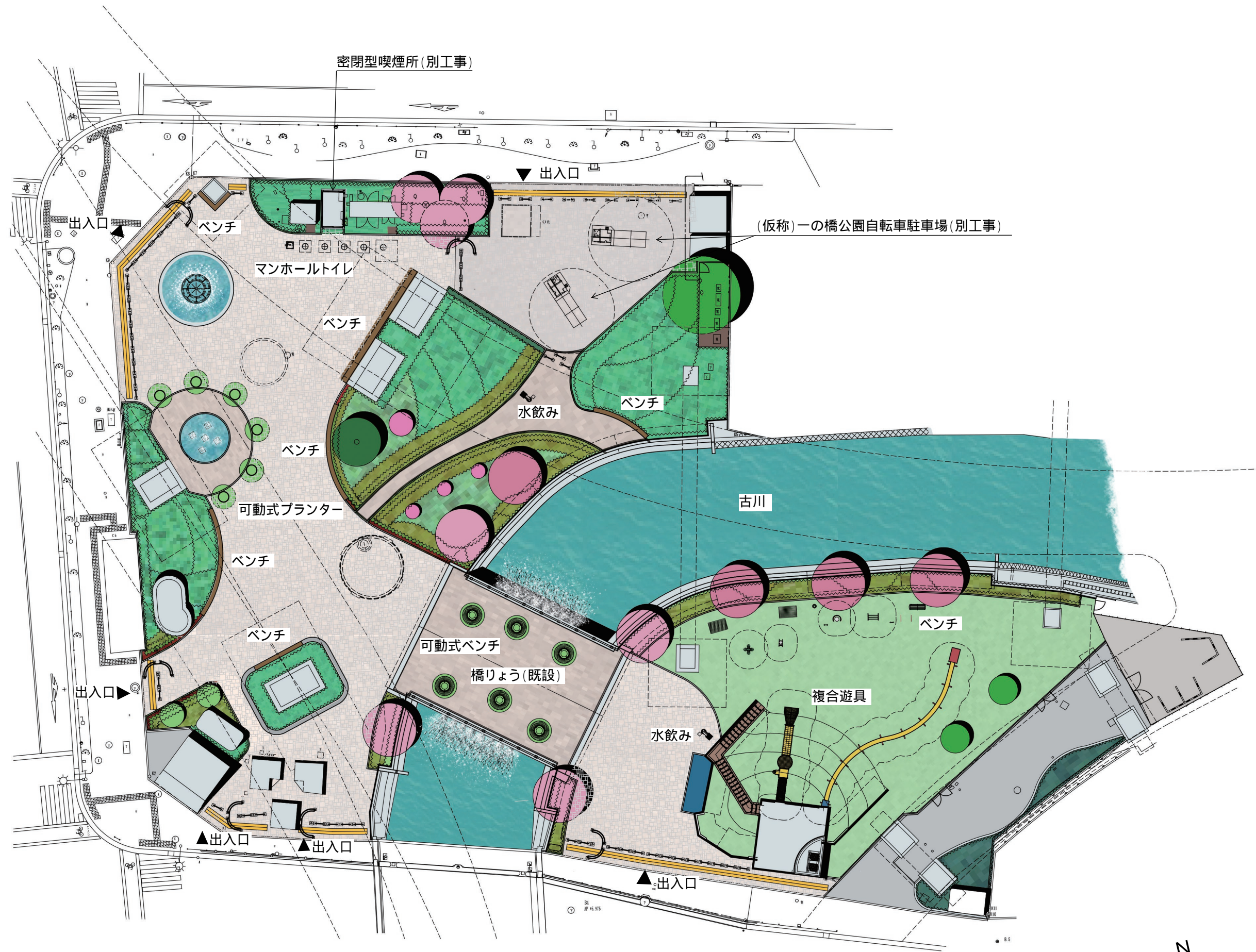
平面図 縮尺1 / 400