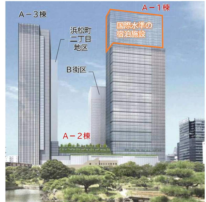
【計画建物の外観イメージ（東側から望む）】