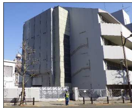
赤坂小学校解体状況

これにより、当初の計画よりも解体期間の延長と解体作業にかかる工程が増大しています。