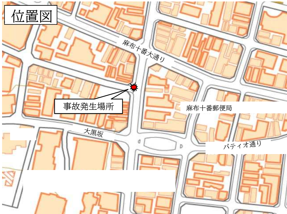
○国土地理院地図 ( http://maps.gsi.go.jp ) での事故発生場所付近イメージ