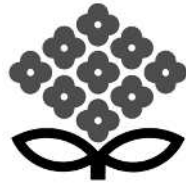
アジサイ ユキノシタ科 日本（関東南部）原産 落葉広葉樹 1.5~2.0m