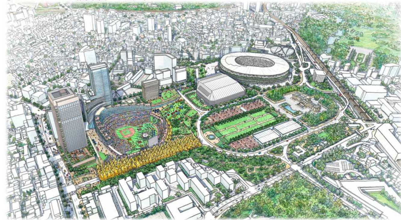
②いちよう並木(青山二丁目交差点)のイメージ