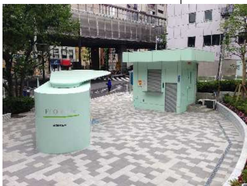
地下機械式自転車駐車場 (イメージ)