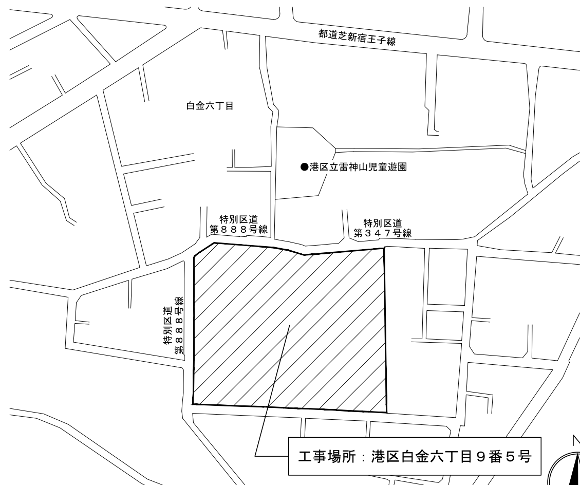
案内図 縮尺 1 / 1,500