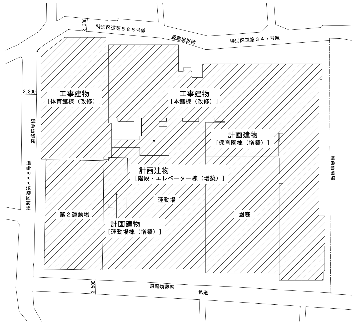
配置図 縮尺 1 / 500