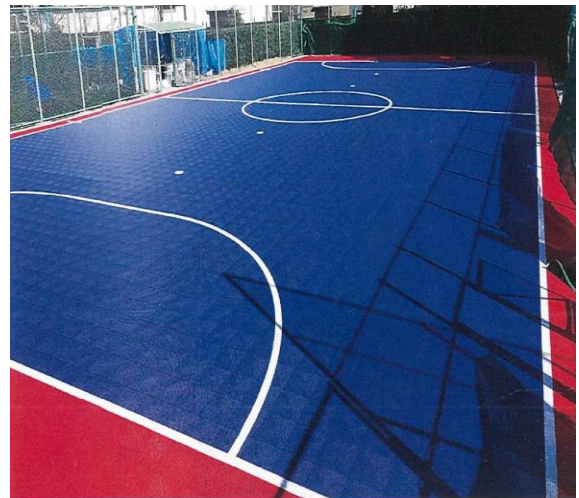
文京区立目白台運動公園フットサルコート