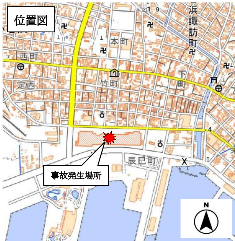
○国土地理院地図 ( http://maps.gsi.go.jp ) での事故発生場所付近イメージ