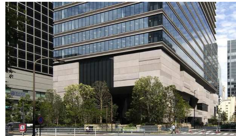
①地区南西から広場2号及び地区内集散道路を望む