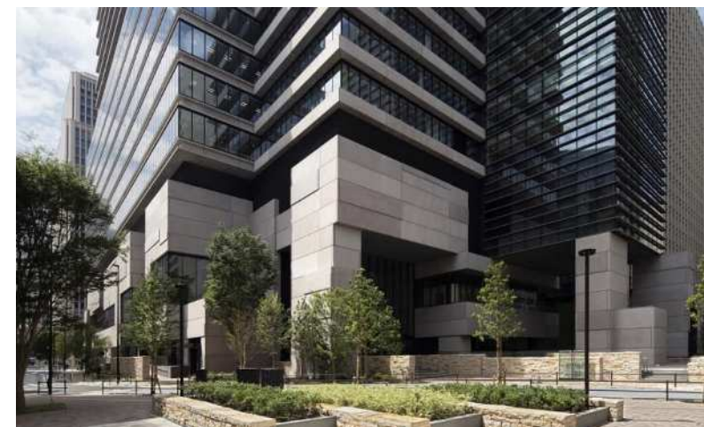
②緑地から建物低層部を望む