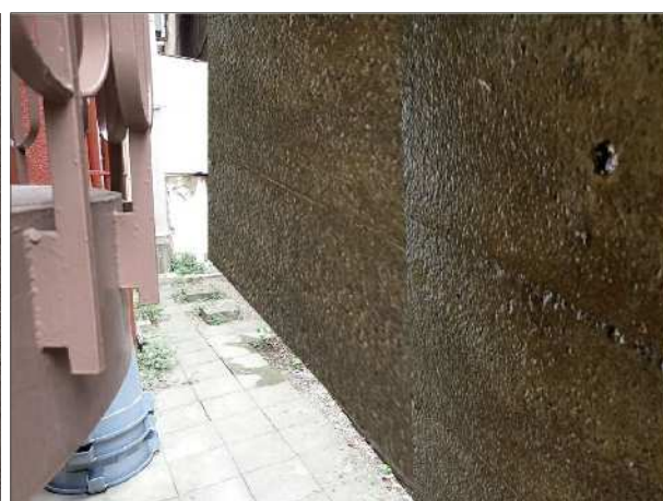
【整備後イメージ図】 (断面修復後)