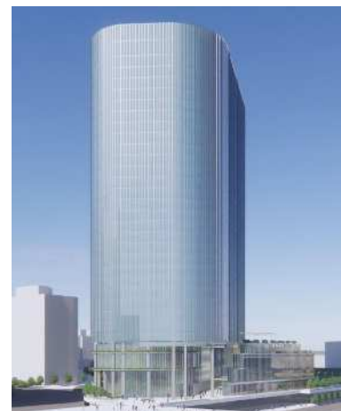
イメージパース（南東方向から）