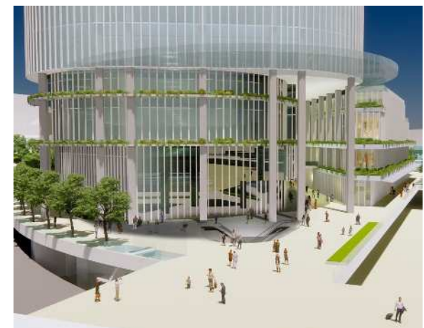
広場5号周辺のイメージ