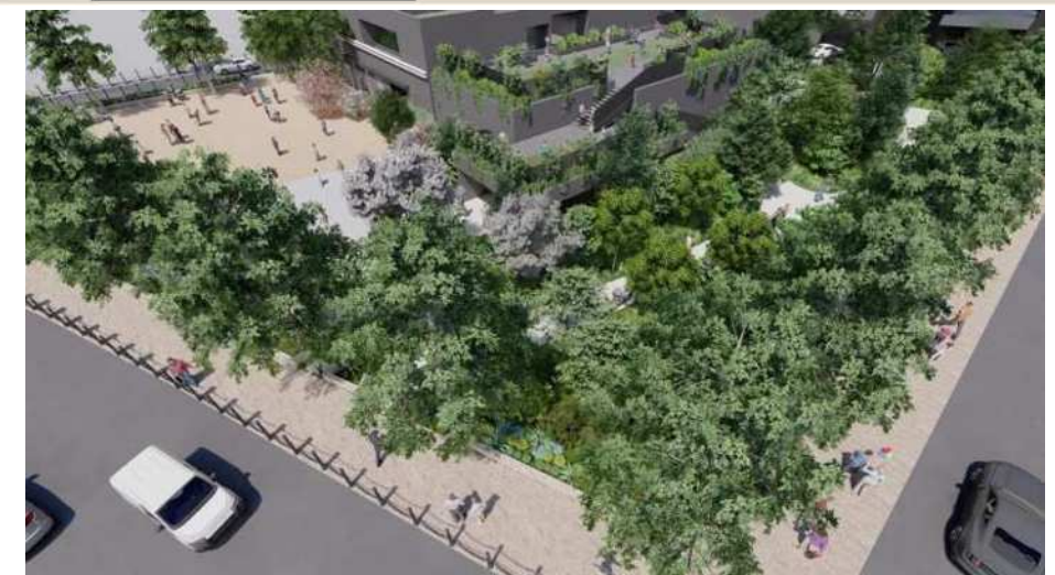
児童遊園と広場1号（北側）の整備イメージ