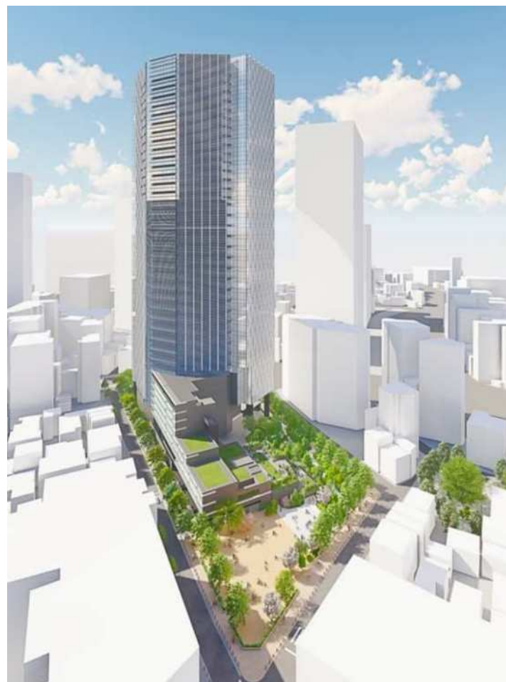
地区東からのイメージパース