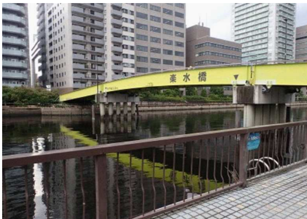
運河沿緑地(港南四丁目側)から撮影