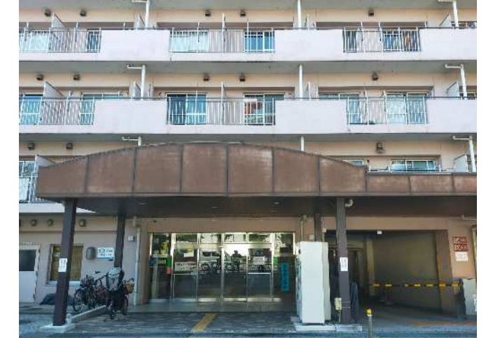
エントランスひさし (写真②)