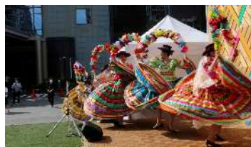
Minato Blossom Festa