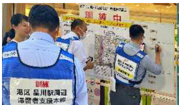
帰宅困難者対策訓練