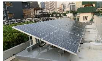
再生可能エネルギーの導入拡大