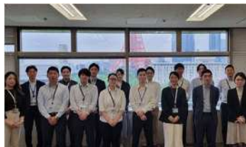
DX推進リーダーの育成