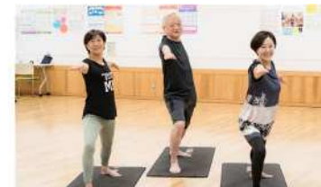
介護予防のためのヨガ教室