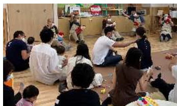
子育てひろばでのイベント