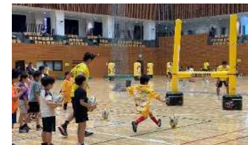
プロスポーツチームによるラグビー体験教室