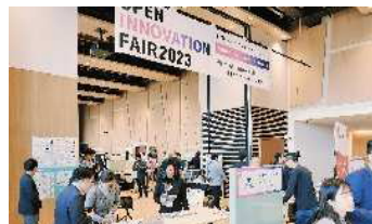
オープンイノベーションフェア