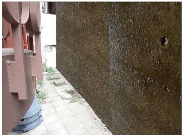
【整備後イメージ図】 (断面修復後)