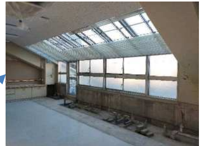
【サッシのシール打ち替え工事】