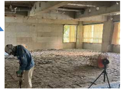
【放課GO→クラブ室設置工事】