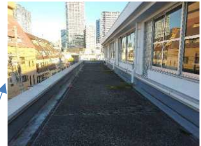
【2階屋上の防水工事】