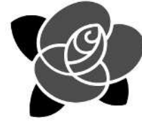
バラ バラ科 日本、中国、欧州原産 常緑落葉低木つる