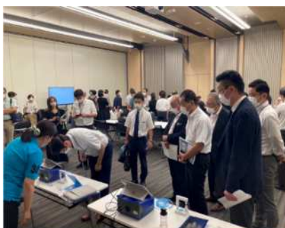
M I C Cの感染対策訓練 全体の様子

また、医療機関においては、院内感染対策委員会や感染制御担当者等を中心に院内感染の防止を図るとともに、実際に行った防止策に関する情報を、都や他の病院等の施設に提供するなど、その共有に努めます。