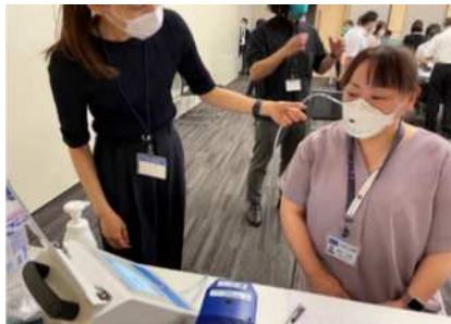
M I C Cの感染対策訓練 マスクフィットテストの様子