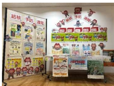
保健所での結核予防月間 パネル展示