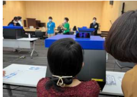
M I C Cの感染対策訓練 手指衛生評価テストの様子