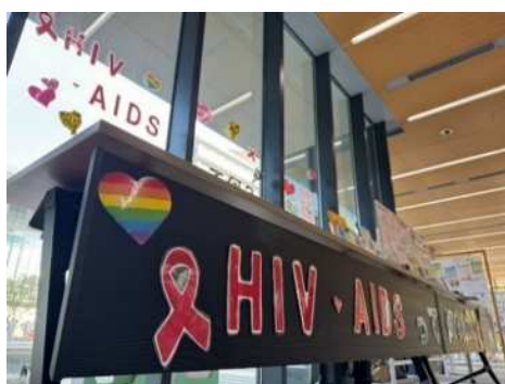
区内大学学園祭へのブース出展

あわせて、定期的に感染症に関する普及・啓発を重点実施する「予防月間」等の機会を活用するとともに、区内の教育機関などと連携した広報や健康教育を行うなど、多様なコミュニティを通じた情報伝達により、効果的に普及・啓発を行います。