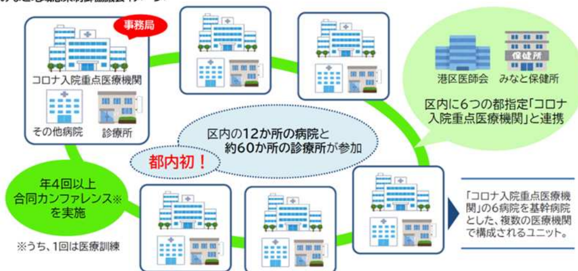
みなと地域感染制御協議会イメージ

MICCは「Minato infection control council」の略です。