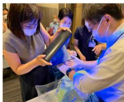
M I C Cの感染対策訓練 排泄物処理手技訓練の様子