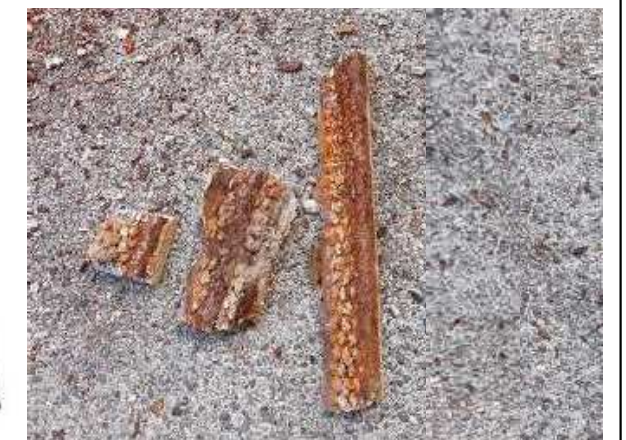
剥離した下地モルタル