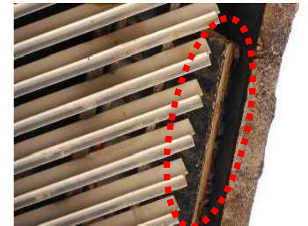
下地モルタル剥離状況