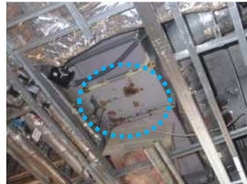
ドレン配管の劣化状況