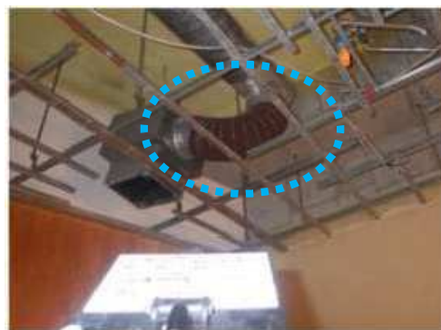
排気ダクトの劣化状況