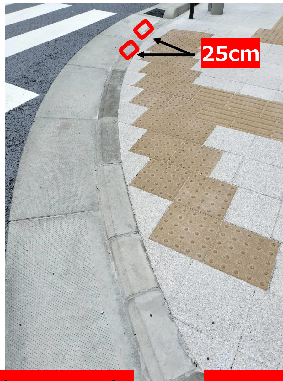
港区の一部 のみの スロープ