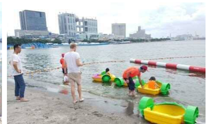
小学生以下はライフジャケット着用。浮き輪等の貸し出しや子ども向けアトラクションなども全て無料。