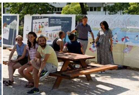
イダルゴ市長(写真右)の現地視察