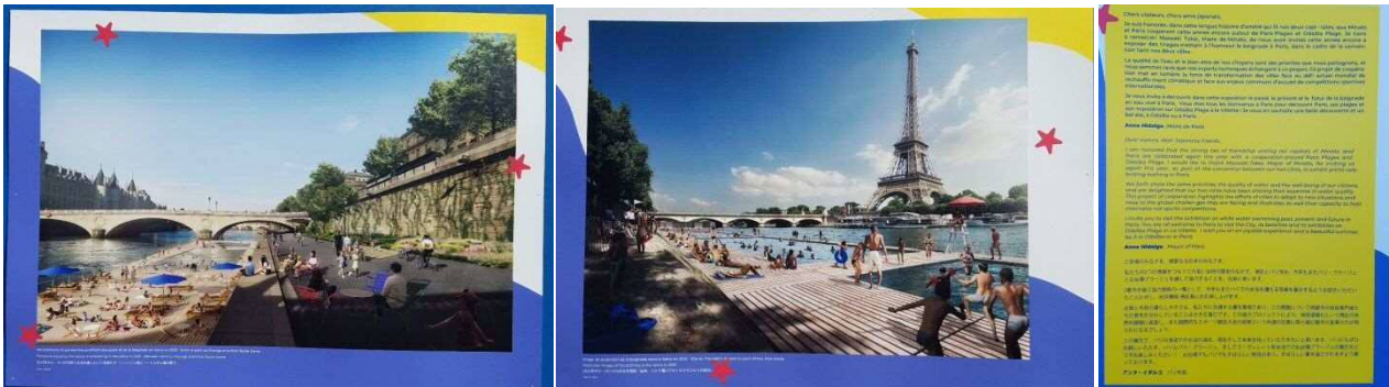
2024年パリ大会以降の「泳げるセーヌ」のイメージパース。