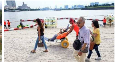
新たに導入したビーチ用車いすは、遊泳だけでなくご家族でビーチを散歩していただくなどの用途がありました。