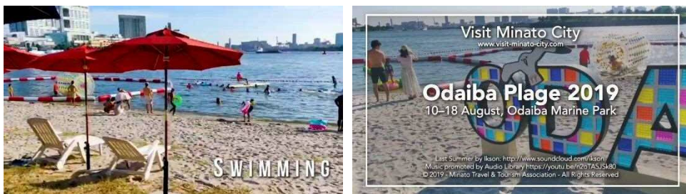
一般社団法人港区観光協会の作成動画。Facebook で 1 万回以上再生。