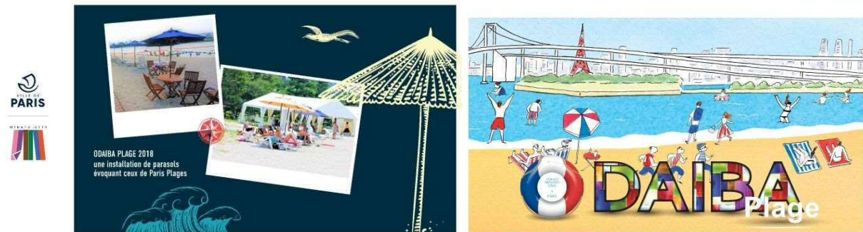
展示したパネルの例