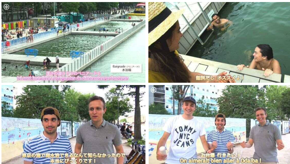
区がパリ市の協力のもと作成した現地取材動画。Facebook で 8000 回以上再生。