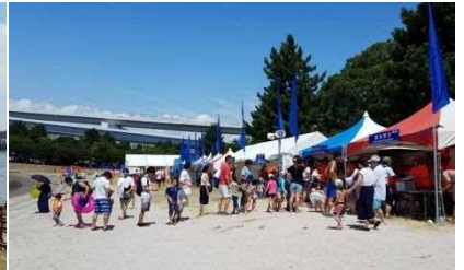
国内外から多くの方が訪れ、海水浴やビーチ沿いでの日光浴などを楽しんでいました。