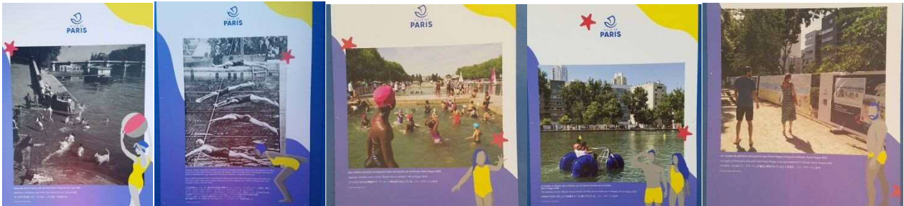
80年以上前に撮影されたセーヌ川の水浴の様子や1924年パリオリンピックなど貴重な写真の他、今年のパリ・ブーラージュ（ヴィレット水浴会場）やお台場ブーラージュ PR 出展の様子も展示。