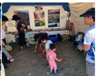
各ブースでは海辺の環境啓発や生物観察を出展。鳥取県・北栄町ブースの「宝探しゲーム」も子どもたちから好評でした。