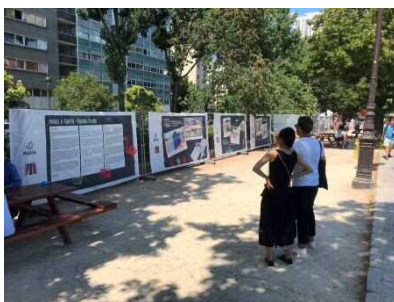
展示パネルを見る来場者