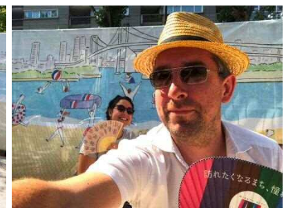
パリ市職員(港区 CP グッズとともに)