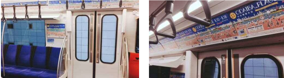
ゆりかもめ車内全面広告（1編成6両車両(7月22日～8月18日)）

また、ゆりかもめ車内全面広告を実施した他、街づくり支援部の協力のもと、ちいばす・レインボーバス車内にてポスターを掲出しました。