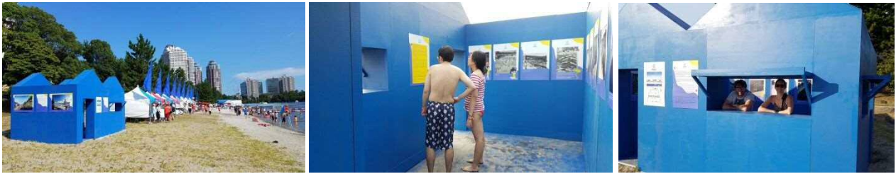
パリ市監修のシンボル小屋では、「泳げるセーヌ」の復活をめざし、過去・現在・未来のセーヌ川をパネル紹介。