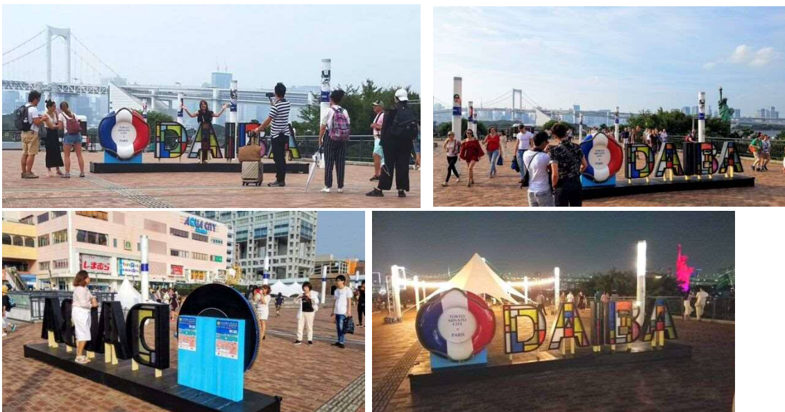
お台場ブーラージュと同時期に、臨海副都心まちづくり協議会が「自由の女神像」周辺で東京2020大会と2024年パリ大会の気運醸成イベントを開催。区は、昨年のお台場ブーラージュのオブジェを再利用して好立地に展示したところ、外国人観光客が次々と写真撮影をするほどの盛況でした。