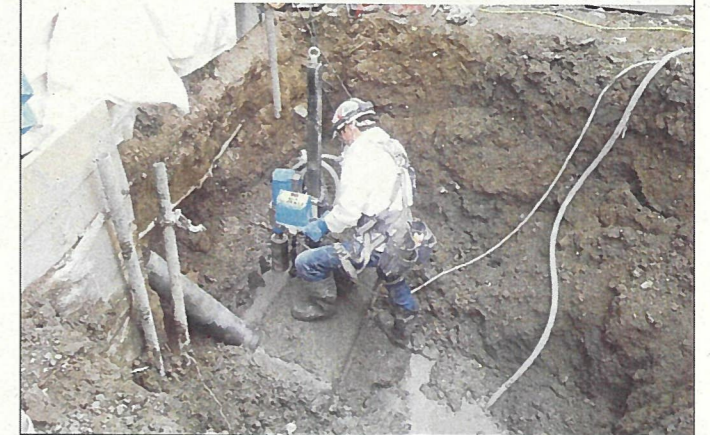
②-1 既存建物より前の構造体