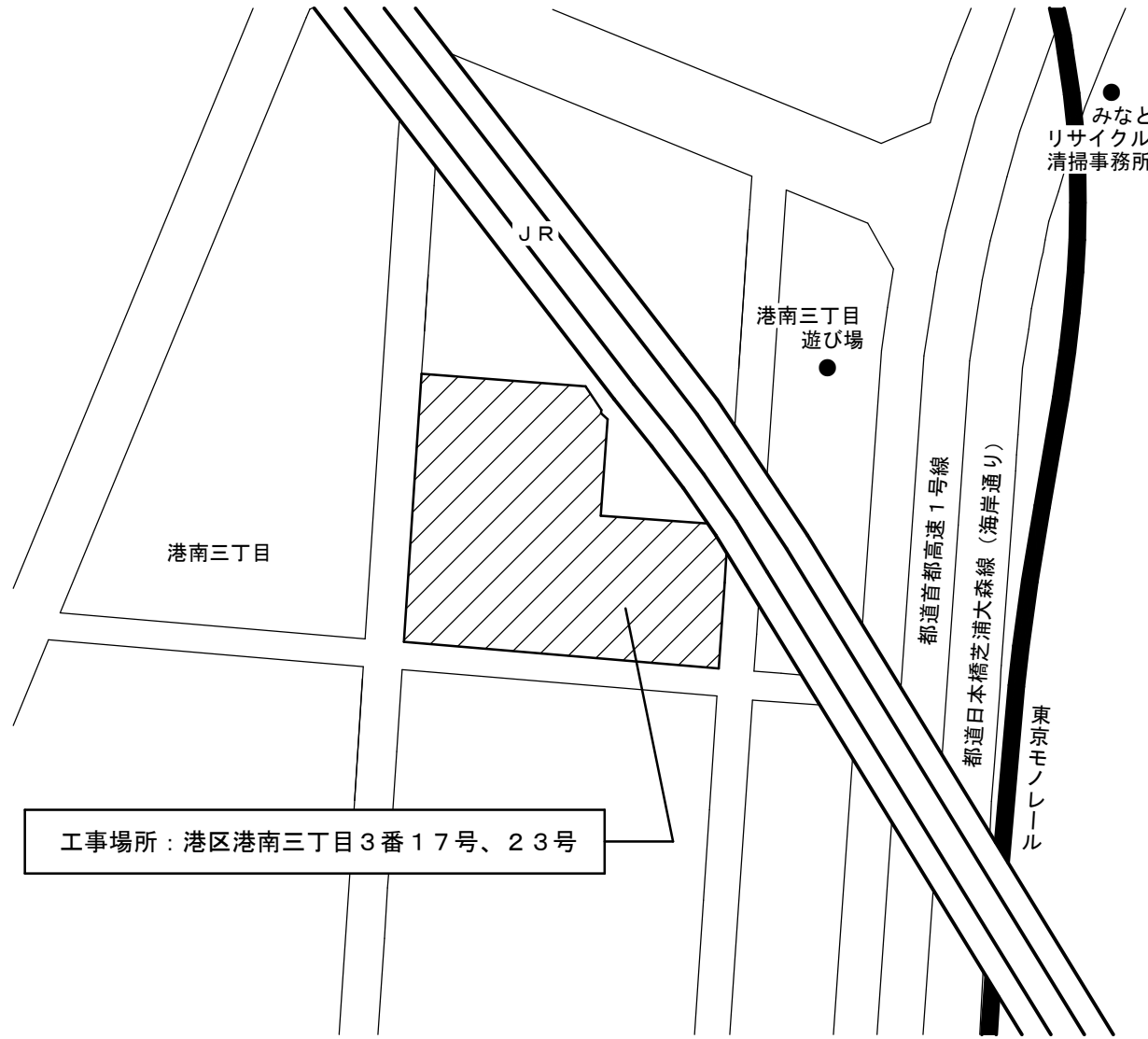
案内図 縮尺 1/2,000