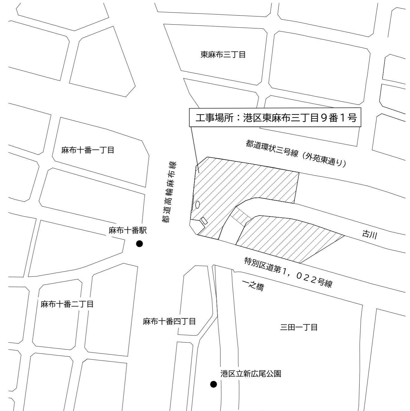
案内図 縮尺 1/2,000