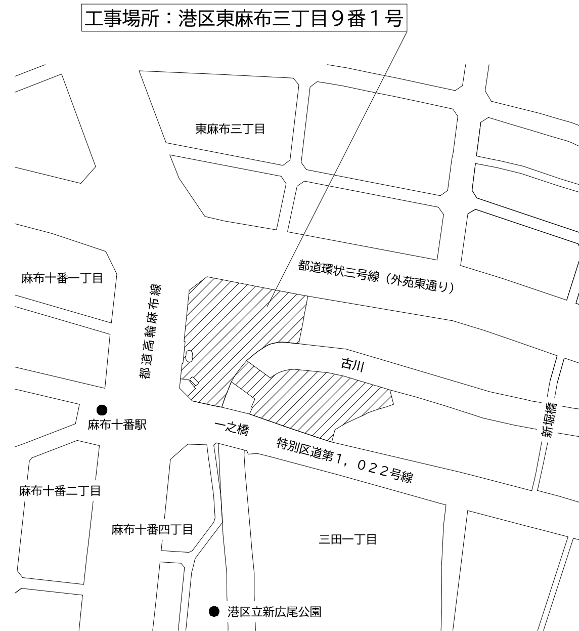
案内図 縮尺 1/2,000