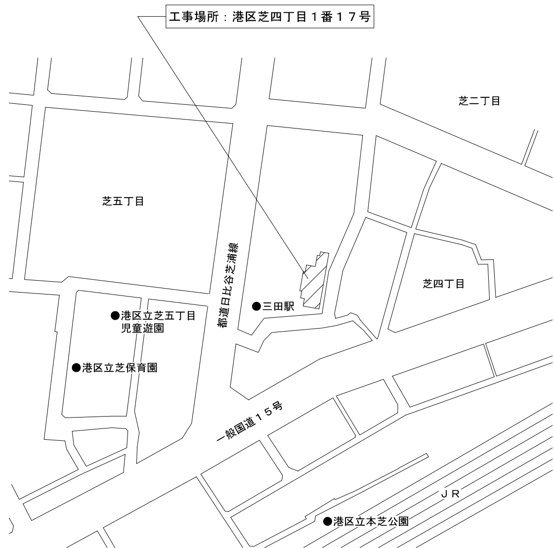
案内図 縮尺 1 / 3,000