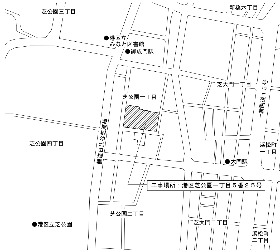
案内図 縮尺 1 / 5,000