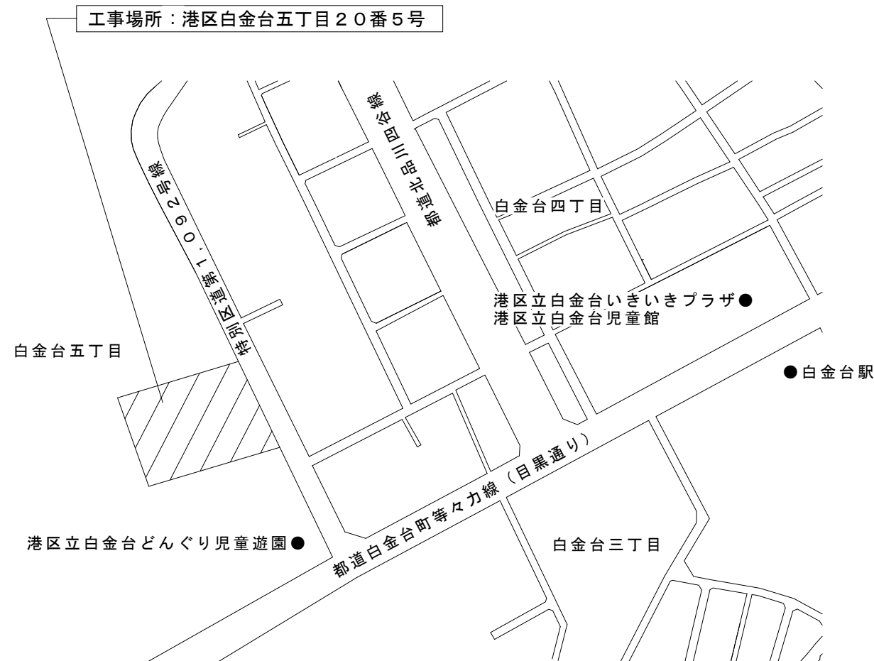
案内図 縮尺 1 / 2,500