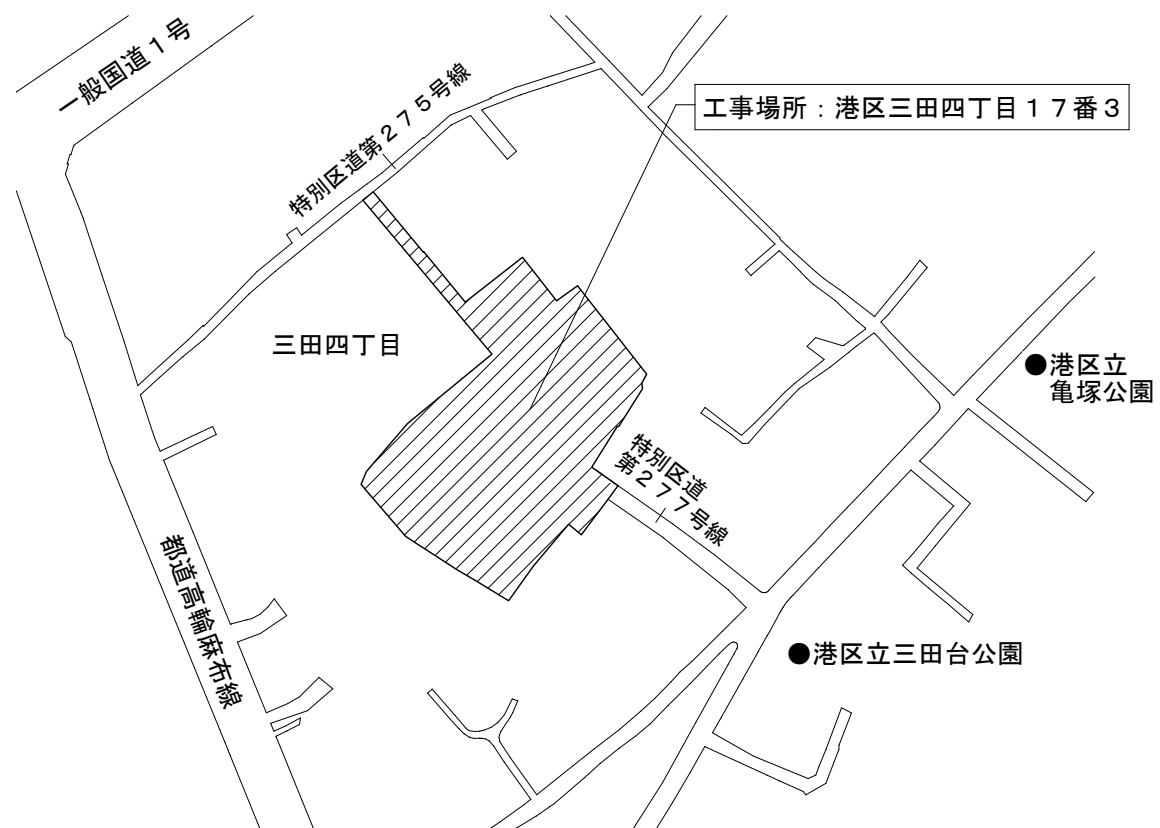
案内図 縮尺 1 / 2,500