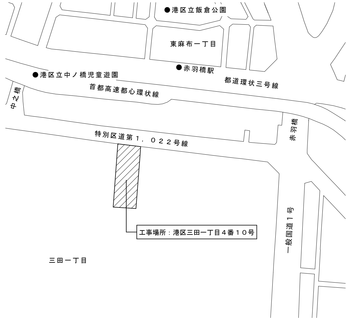
案内図 縮尺 1 / 2,000