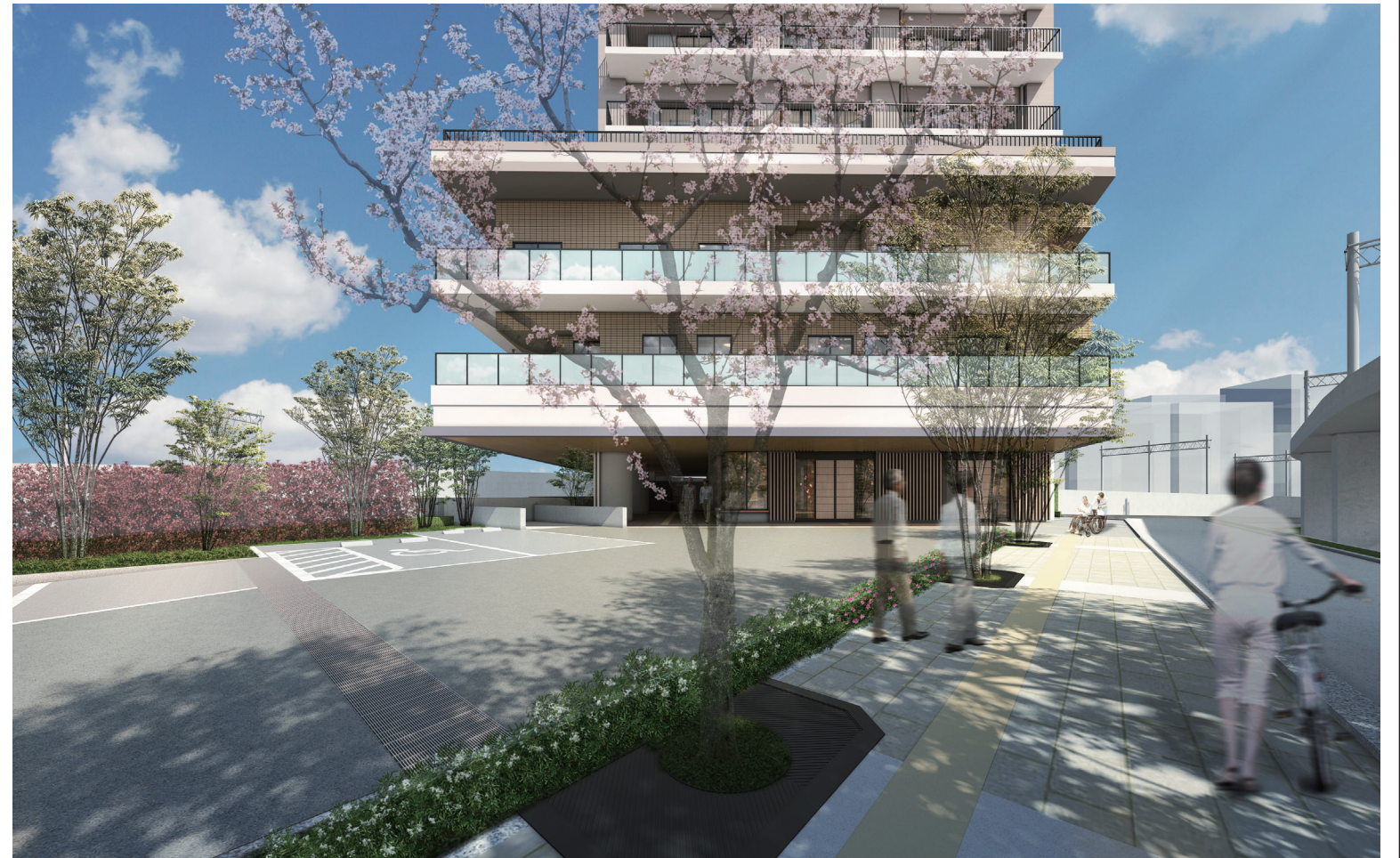
東側立面イメージ