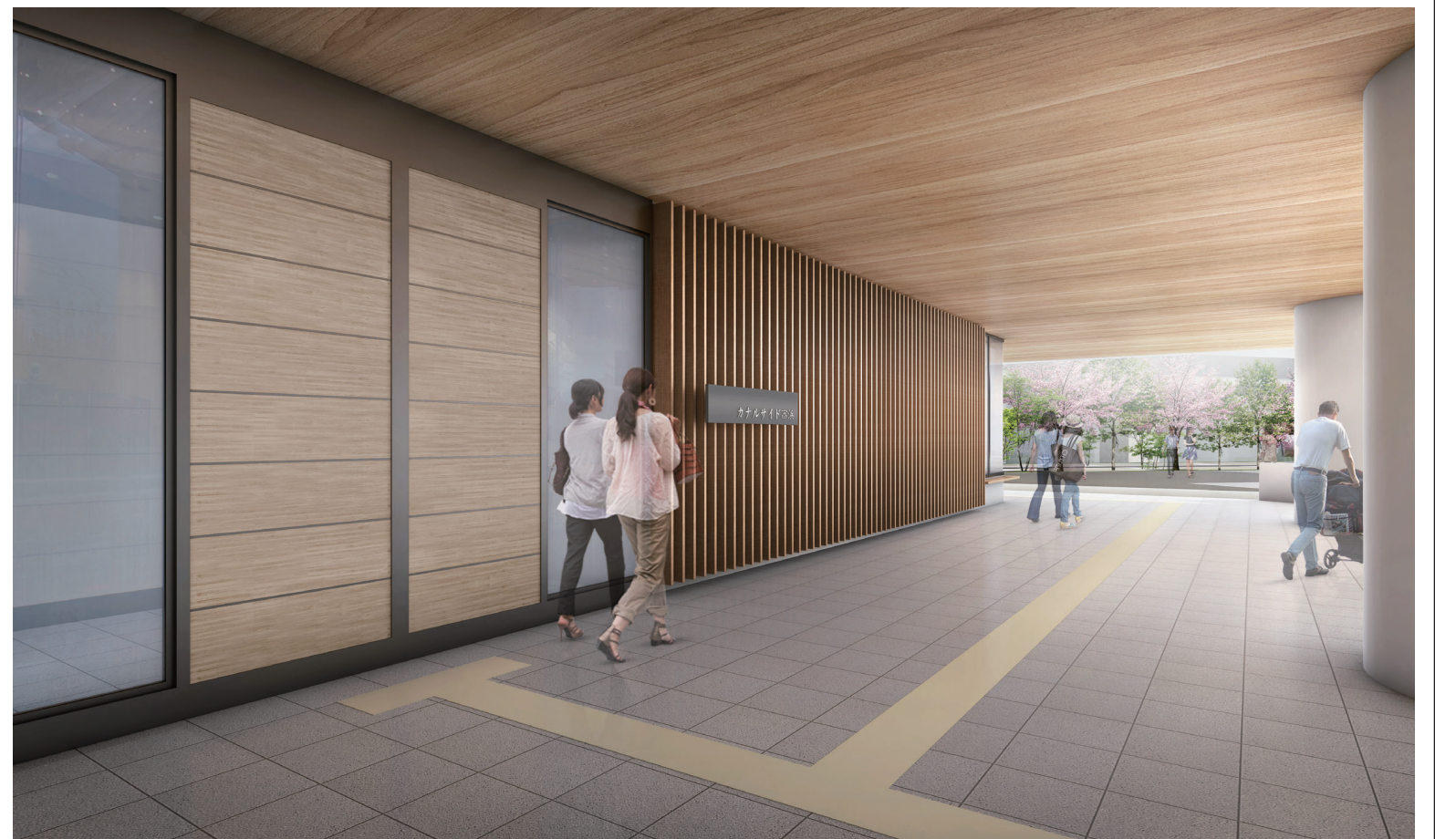
ピロティイメージ