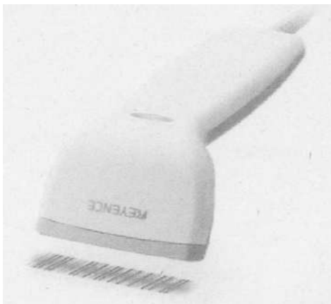
4 バーコードリーダー