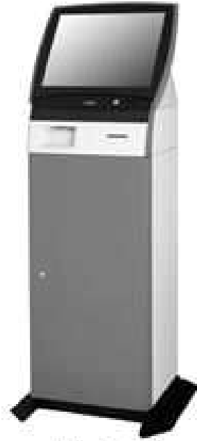
5 図書館資料自動貸出機