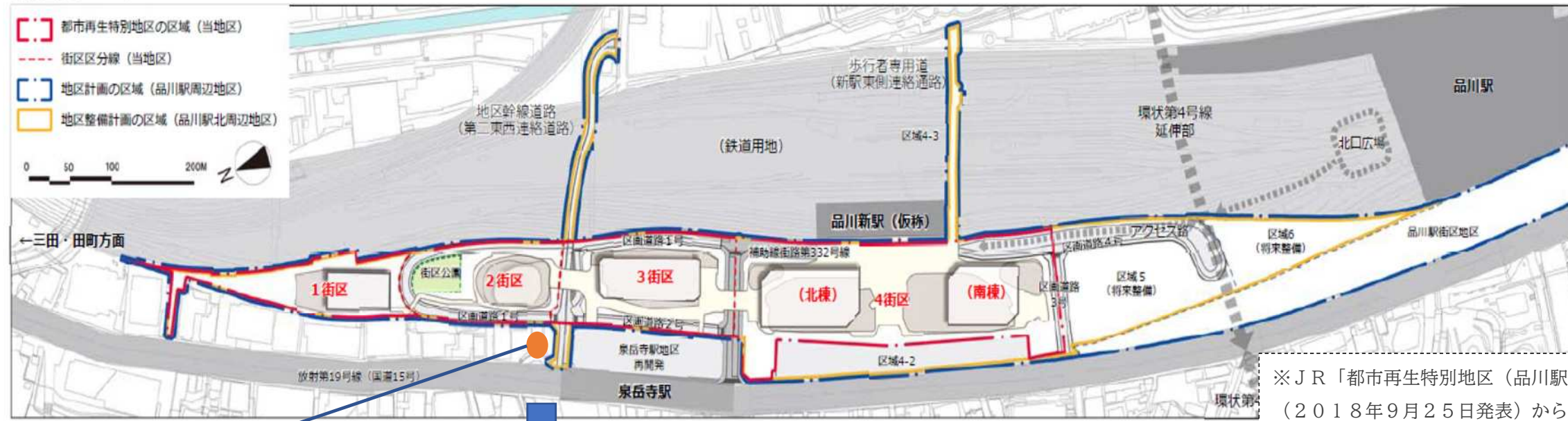
※JR「都市再生特別地区（品川駅北周辺地区）都市計画（素案）の概要」（2018年9月25日発表）から抜粋