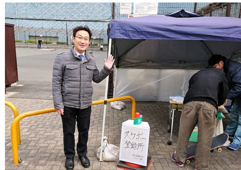
平成 31 年 3 月登録制度開始時はブースを公園前に設置