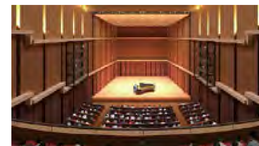
大ホールイメージパース 客席側から (音響反射板設置時)