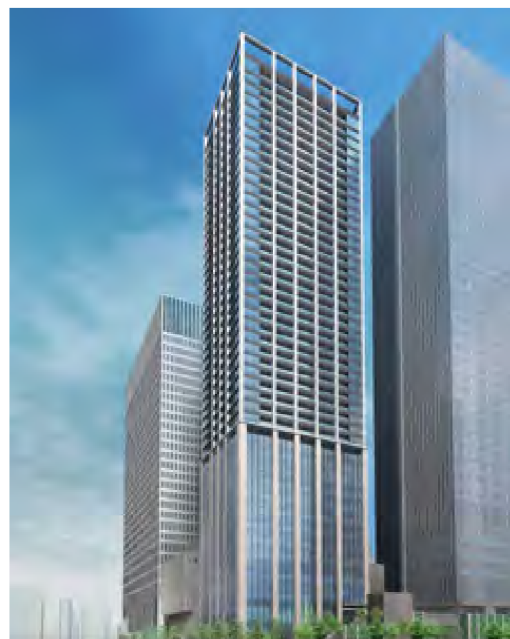
複合ビルイメージ図 (仮称)文化芸術ホールは主に3階～5階部分