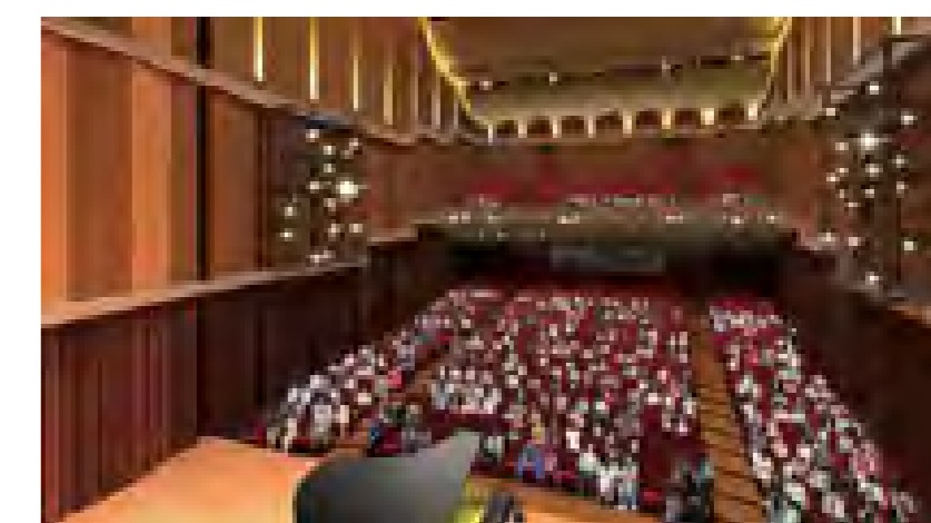
大ホールイメージパース 舞台側から (音響反射板設置時)