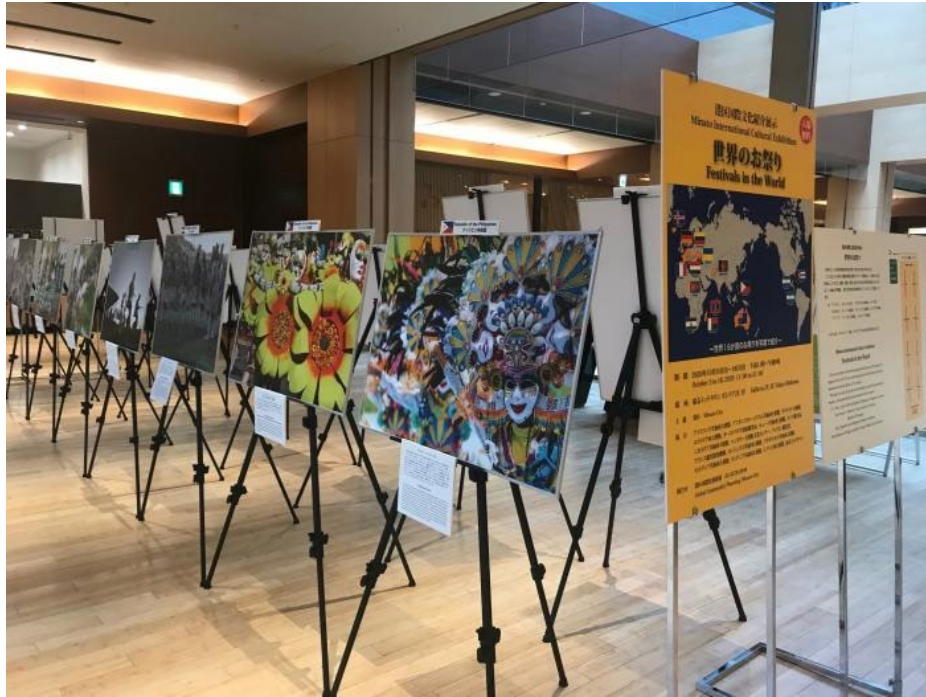
質問時使用パネル