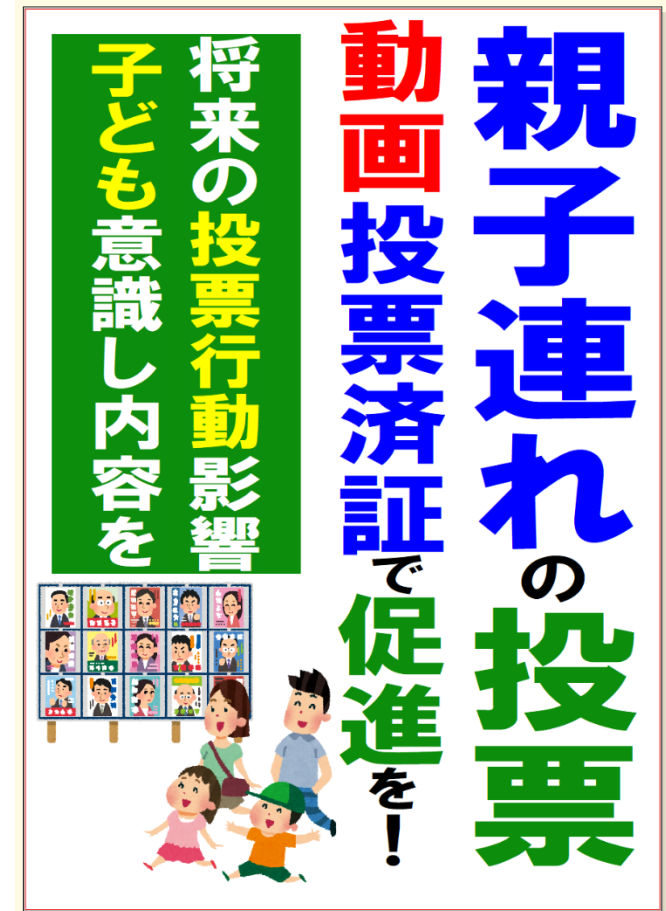
質問時使用パネル