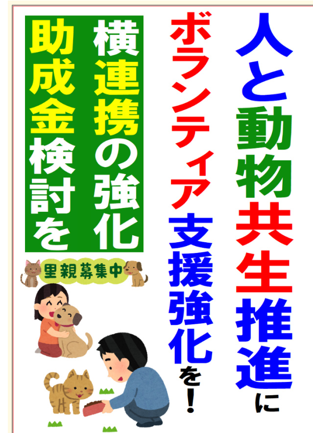
質問時使用パネル