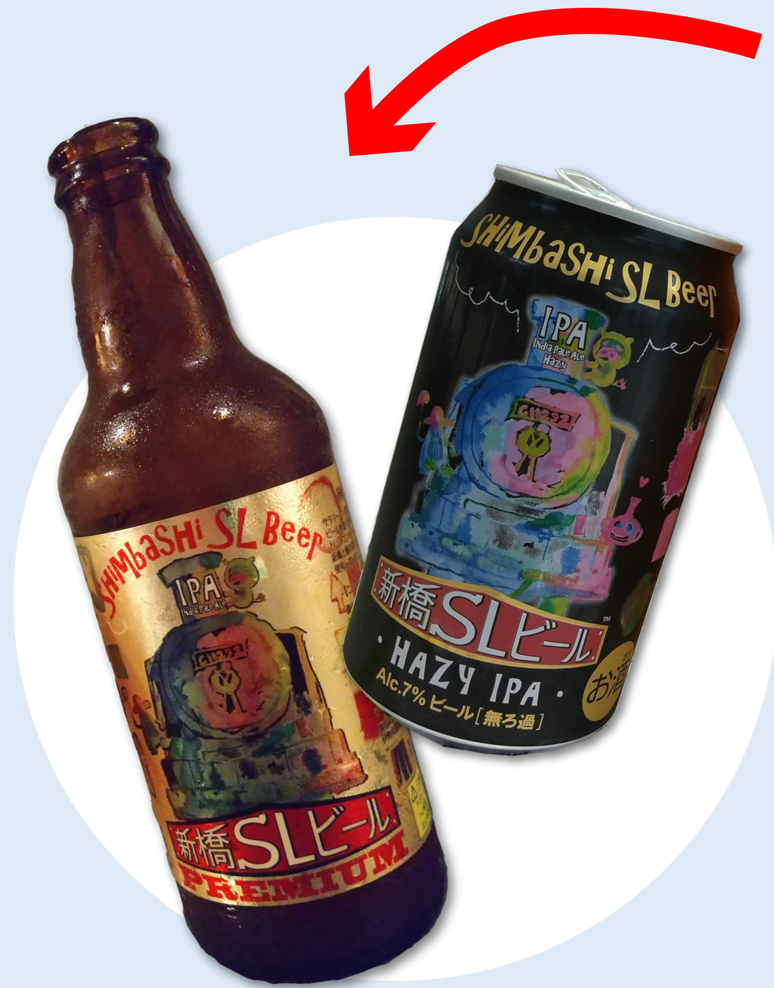
活用事例：新橋SLビール