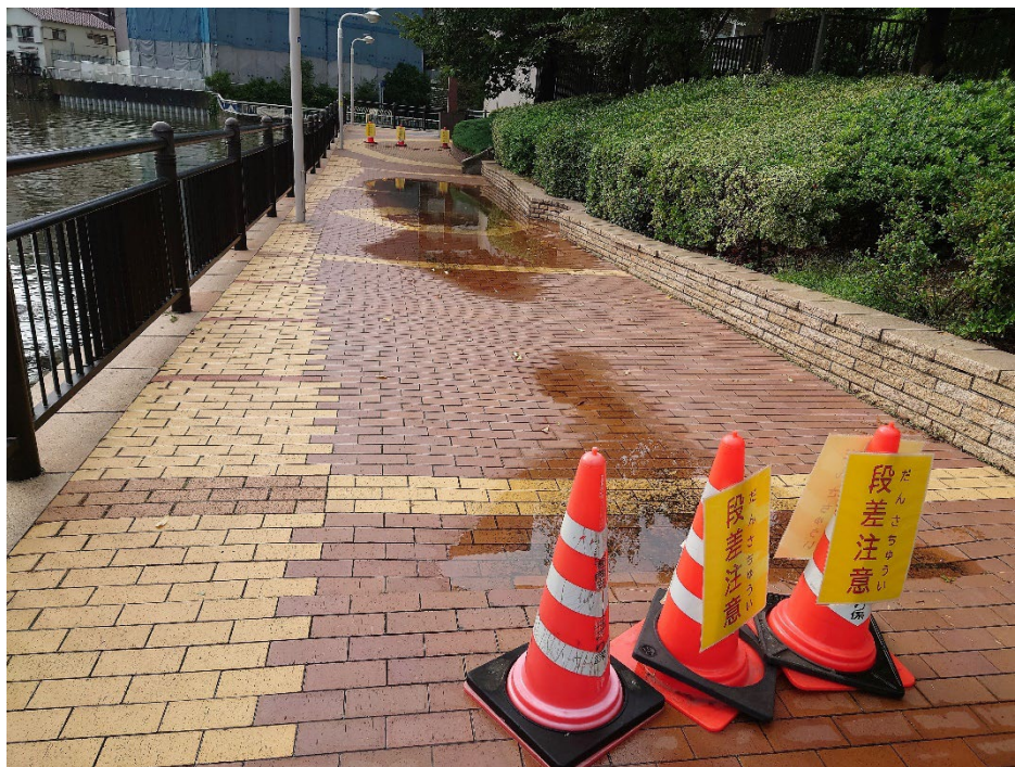
芝浦アイランド南地区南側護岸の段差(陥没)