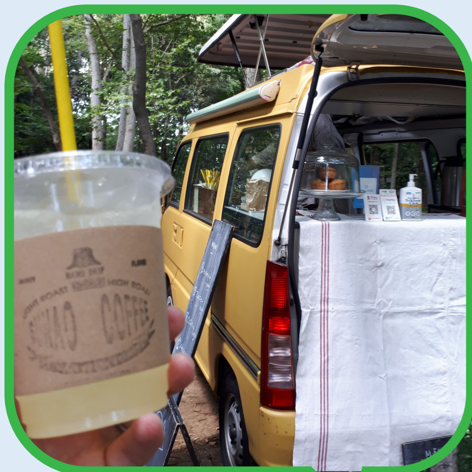
都立芝公園 8号地に出店する移動販売車 (2020年10月)