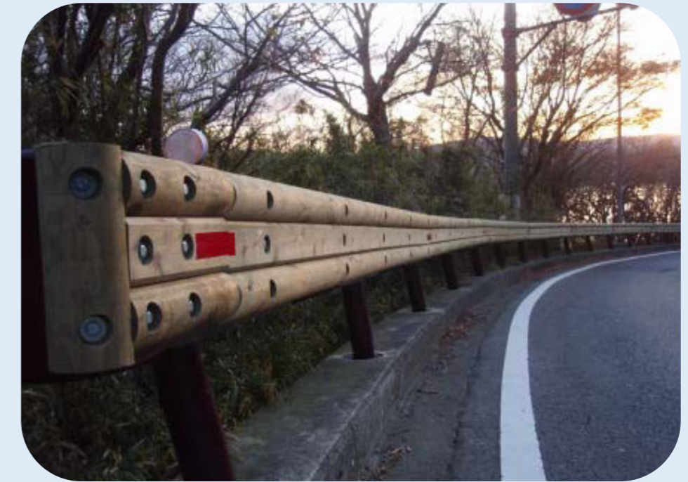
箱根などで見かける 木材を張り付けたガードレール