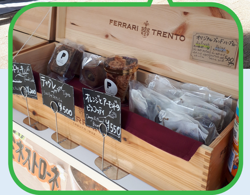
都立林試の森公園に出店する移動販売車 (2022年7月)