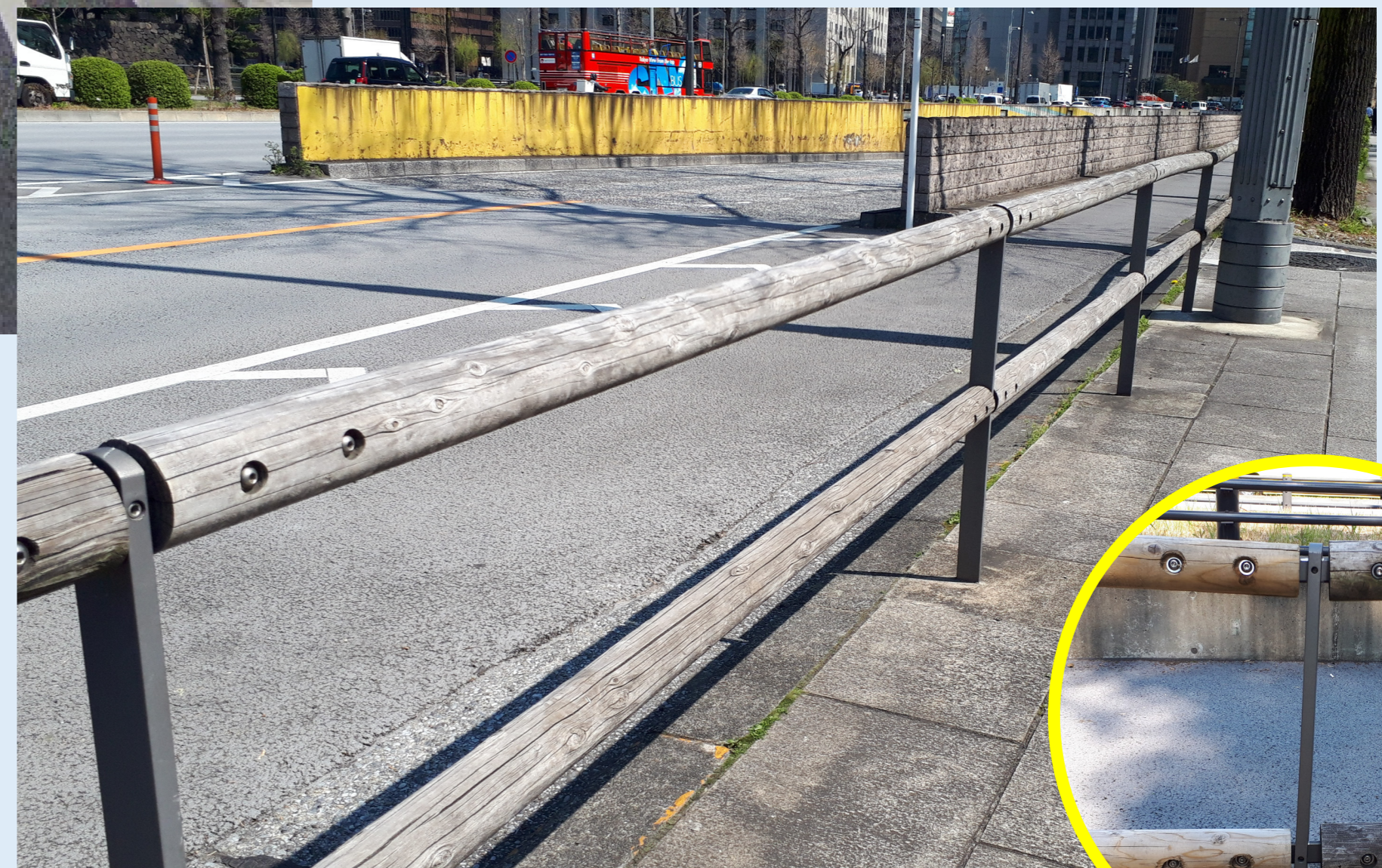
都立日比谷公園皇居側の木製防護柵