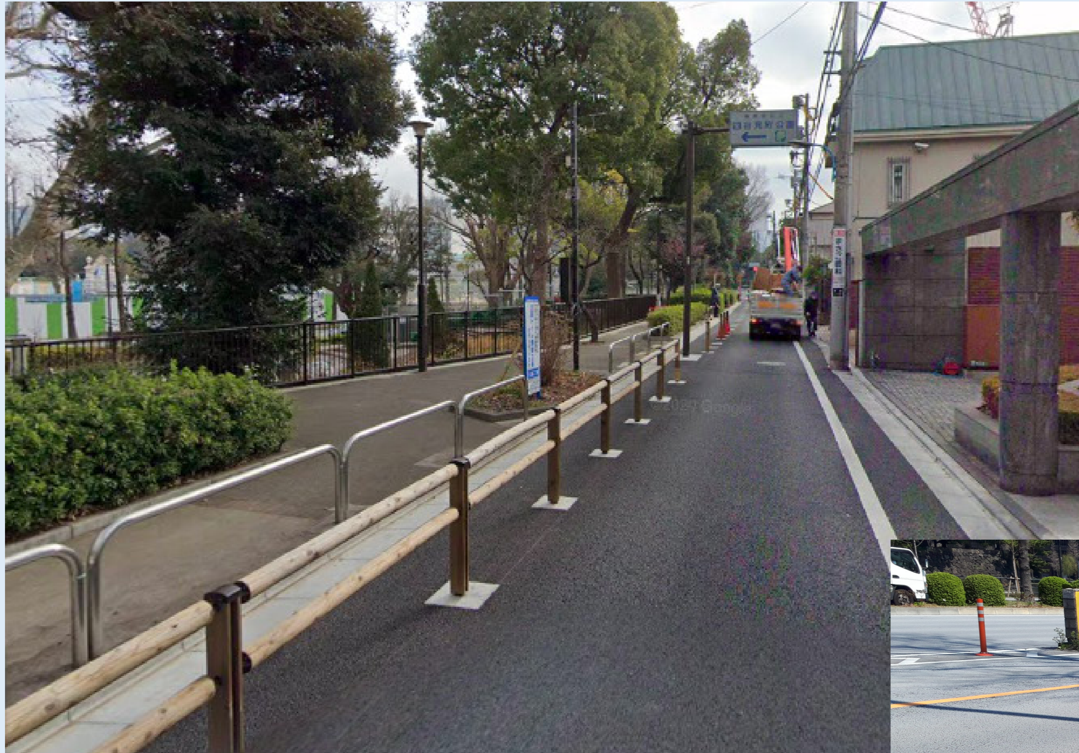
新宿区立四谷見附公園付近の木製防護柵