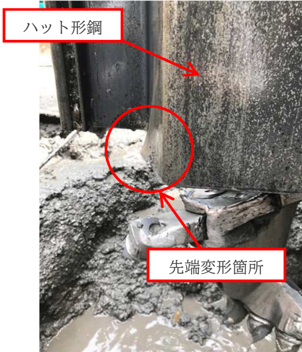
先端が変形したハット形鋼