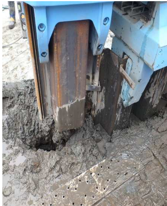
変形していないハット形鋼